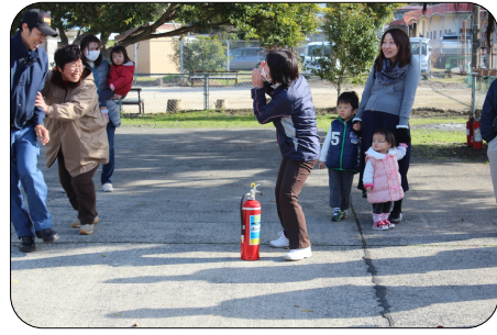
① 「火事だ、火事だ、と叫ぶ