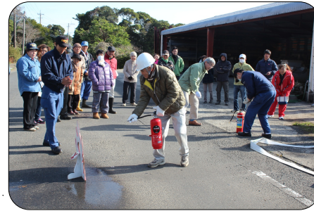
保護具のヘルメット、大切なこと