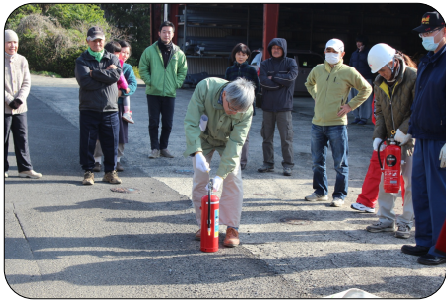
② 消火器のピンを抜く