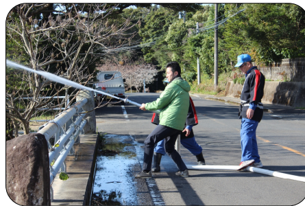
へっぴり腰にならないように