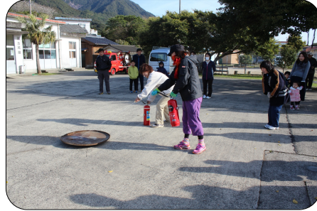
④ 放水をする、近付きすぎない